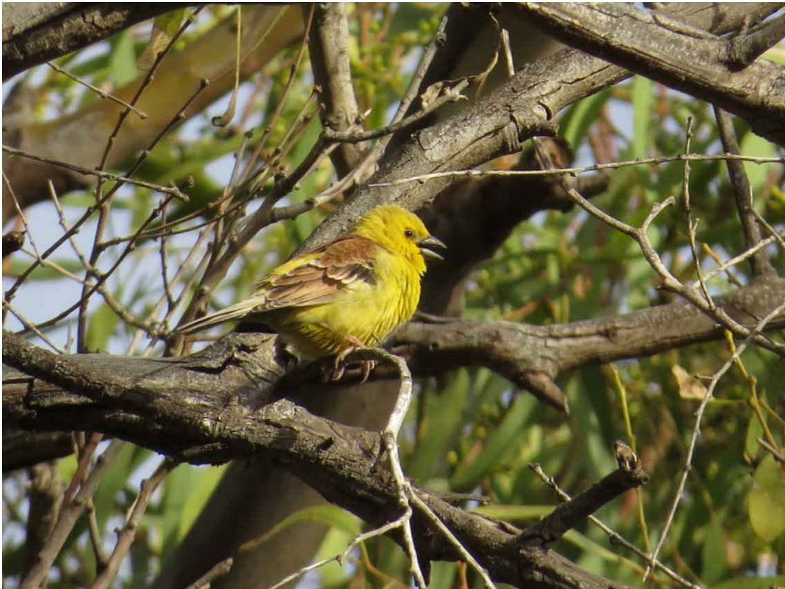
Gorrión dorado ( Passer luteus), Pájara, 22 de diciembre de 2016