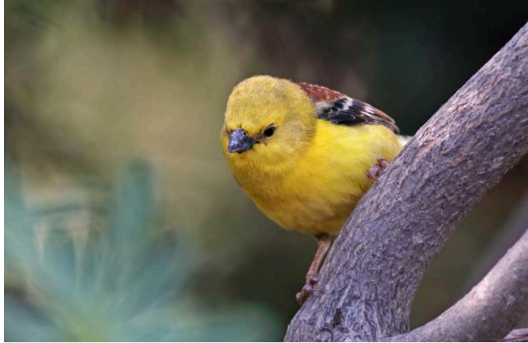
Gorrion dorado ( Passer luteus ), Pájara, Fuerteventura

http://www.go-south.org/wp-content/uploads/2014/12/gsb_11_113-211.pdf