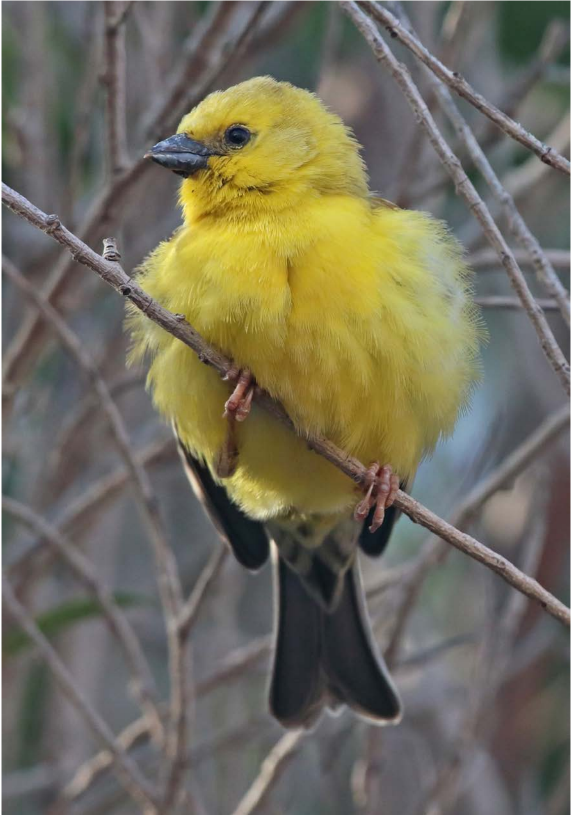
Gorrion dorado ( Passer luteus ), Pájara, Fuerteventura