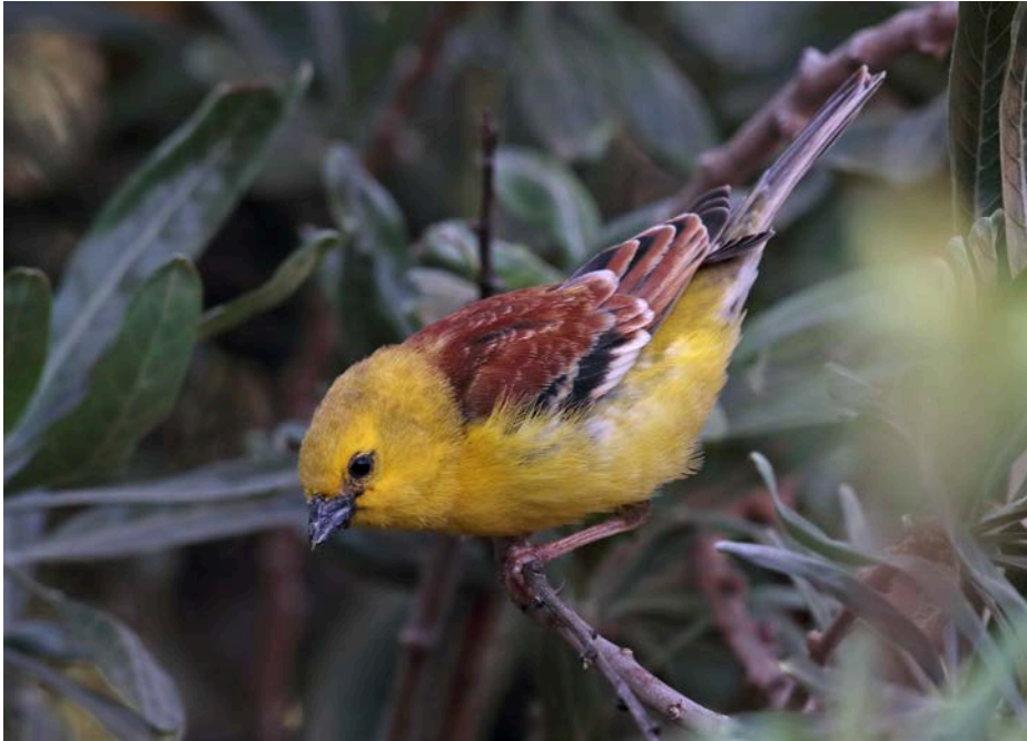
Gorrión dorado ( Passer luteus ), Pájara, Fuerteventura

Localización exacta del Gorrión dorado ( Passer luteus ) en Pájara, Fuerteventura 28° 21.102'N 14° 6.376'O