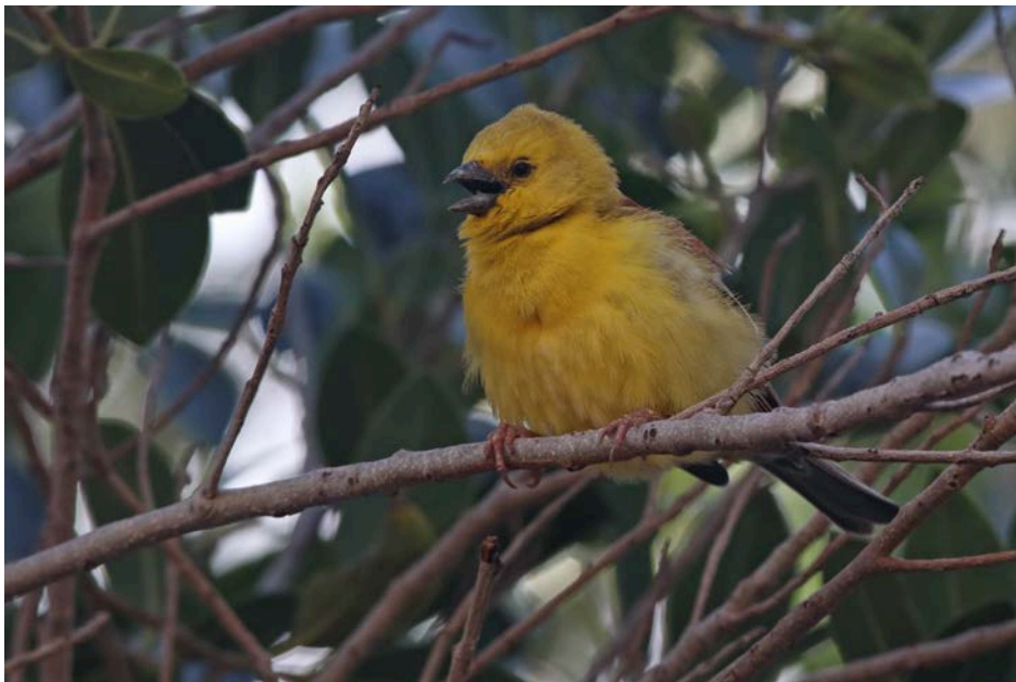
Gorrión dorado ( Passer luteus ) reclamando constantemente desde el árbol donde tiene situado su nido. Pájara, Fuerteventura

En mi visita de 3 horas de duración al jardín pude constatar que únicamente había un único pájaro, un macho, que lógicamente no había juveniles en la zona y que tenía un nido prácticamente hecho y que terminaba de arreglar en un árbol próximo a una barbacoa y que defendía con insistencia de la presencia cerca a él de machos de Gorrión moruno ( Passer hispaniolensis )