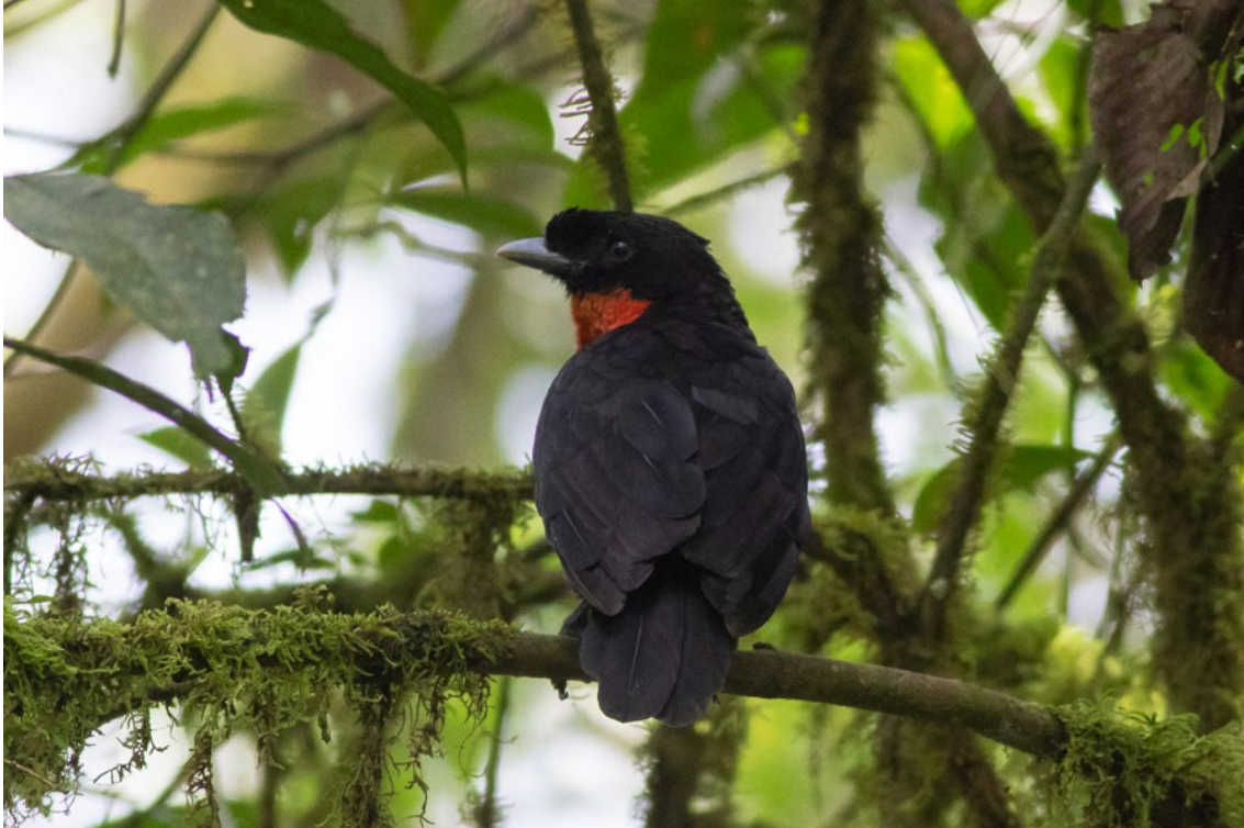
Red-ruffed Fruitcrow en Otún Quimbaya ©Ferran López