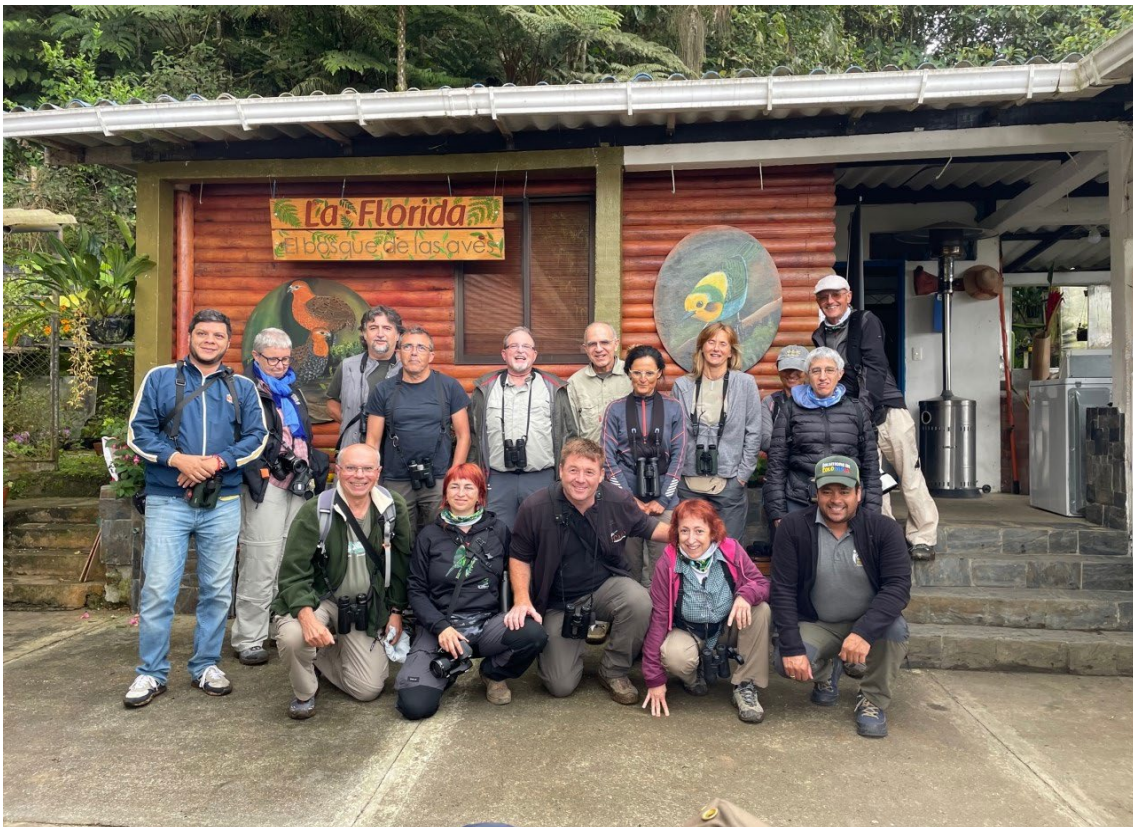
Primer día de pajareo en La Florida

Ecuador y Panamá ) y el esperado Blue-headed Sapphire ( endémico junto a Ecuador ). Además, observamos una cópula de Golden-headed Quetzal , Smoky-brown Woodpecker , Cinnamon Flycatcher , Golden-crowned Flycatcher , Green Jay , Golden-naped Tanager , Scrub Tanager ( endémico junto a Ecuador ), Bananaquit y Black-winged Saltator , entre otras. Llegaba la hora de dirigirnos hacia el pueblo de El Queremal donde pasaríamos nuestras dos primeras noches. Tras una merecida cena y repasar la lista de las aves diaria con nuestra checklist personal, nos iríamos a descansar para recuperarnos de un primer día repleto de nuevas experiencias y muchísimas especies nuevas.