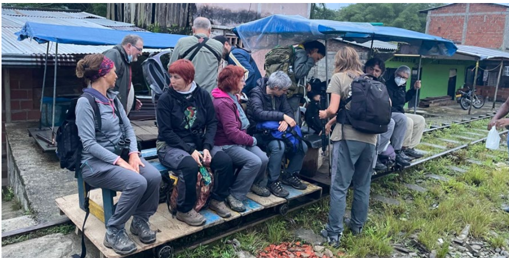
Preparados para el trayecto en Brujita

Antvireo, Pacific Antwren, White-flanked Antwren, Chestnut-backed Antbird o también llamado Short-tailed Antbird, Stub-tailed Antbird (endémico junto a Ecuador), Zeledon’s Antbird, Black-striped Woodcreeper, Striped Woodhaunter, Blue-crowned Manakin, Golden-collared Manakin, Purple-throated Fruitcrow, Cinnamon Becard, Sulphur-rumped Flycatcher, Olive-striped Flycatcher, Black-capped Pygmy-Tyrant, Pacific Flatbill, Long-tailed Tyrant, White-ringed Flycatcher, Black-chested Jay, Grey-breasted Martin, Tawny-faced Gnatwren, Stripe-throated Wren, Bay Wren, Fulvous-vented Euphonia, Buff-rumped Warbler, Tawny-crested Tanager, Grey-and-gold Tanager (endémico junto a Panamá y Ecuador), Rufous-winged Tanager, Blue-whiskered Tanager (endémico junto a Ecuador) y Scarlet-browed Tanager , entre otras aves. Tras un increíble almuerzo donde pudimos saborear una de las delicias de la zona, una especie de cangrejo de río llamado Muchillá , fuimos regresando de nuevo hacia la Brujita para emprender el trayecto hacia nuestro alojamiento cercano a la laguna de Sonso. Después de la cena, repasamos la lista de aves diaria y nos fuimos a descansar.