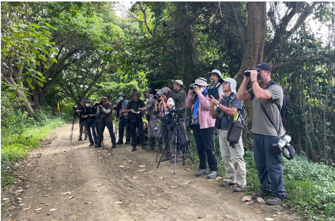
Observando una pareja del endémico Greyish Piculet en la Laguna de Sonso

Becard , Slate-headed Tody-Flycatcher , Common Tody-Flycatcher , Yellow-olive Flycatcher , Yellow-crowned Tyrannulet , Vermilion Flycatcher , Pied Water-Tyrant , Lesser Goldfinch , Shiny Cowbird , Crimson-backed Tanager , Ruddy-breasted Seedeater , entre otras especies. Después del almuerzo tocaba regresar de nuevo a nuestro minibús para dirigirnos hacia Montezuma, al Parque Nacional Natural de Tatamá. Cena, lista de aves diaria y descanso.