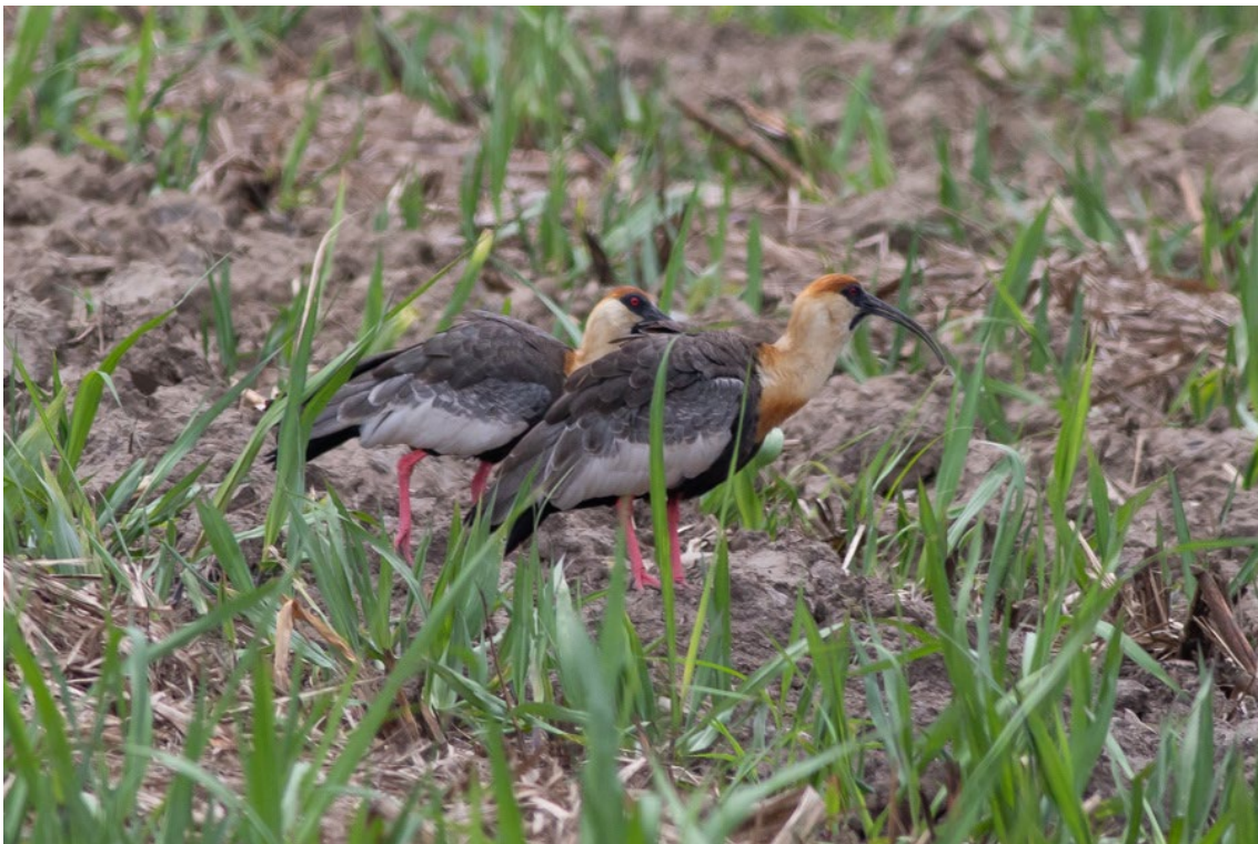
Buff-necked Ibis en los campos del alrededor de la laguna de Sonso

Little Blue Heron Egretta caerulea Cattle Egret Bubulcus ibis Striated Heron Butorides striata Black-crowned Night-Heron Hyticorax nycticorax Glossy Ibis Plegadis falcinellus Green Ibis Mesembrinibis cayennensis Bare-faced Ibis Phimosus infuscatus Buff-necked Ibis Theristicus caudatus