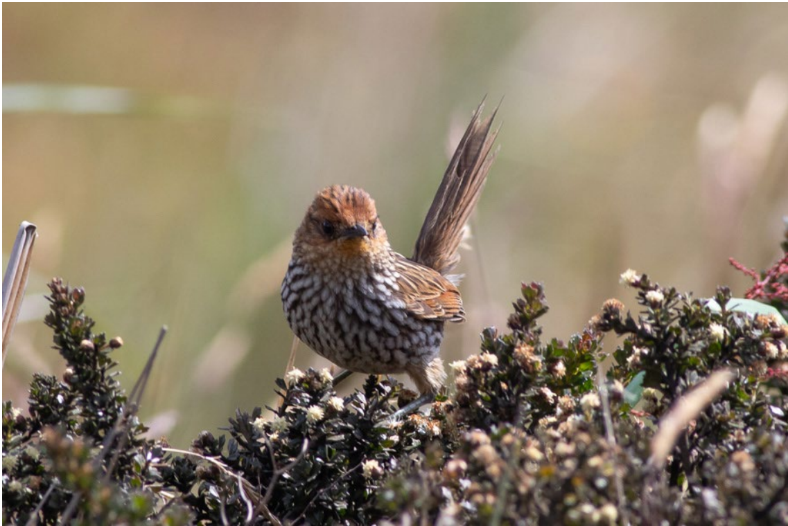
Many-striped Canastero en la Laguna Negra de Los Nevados

Many-striped Canastero Asthenes flammulata