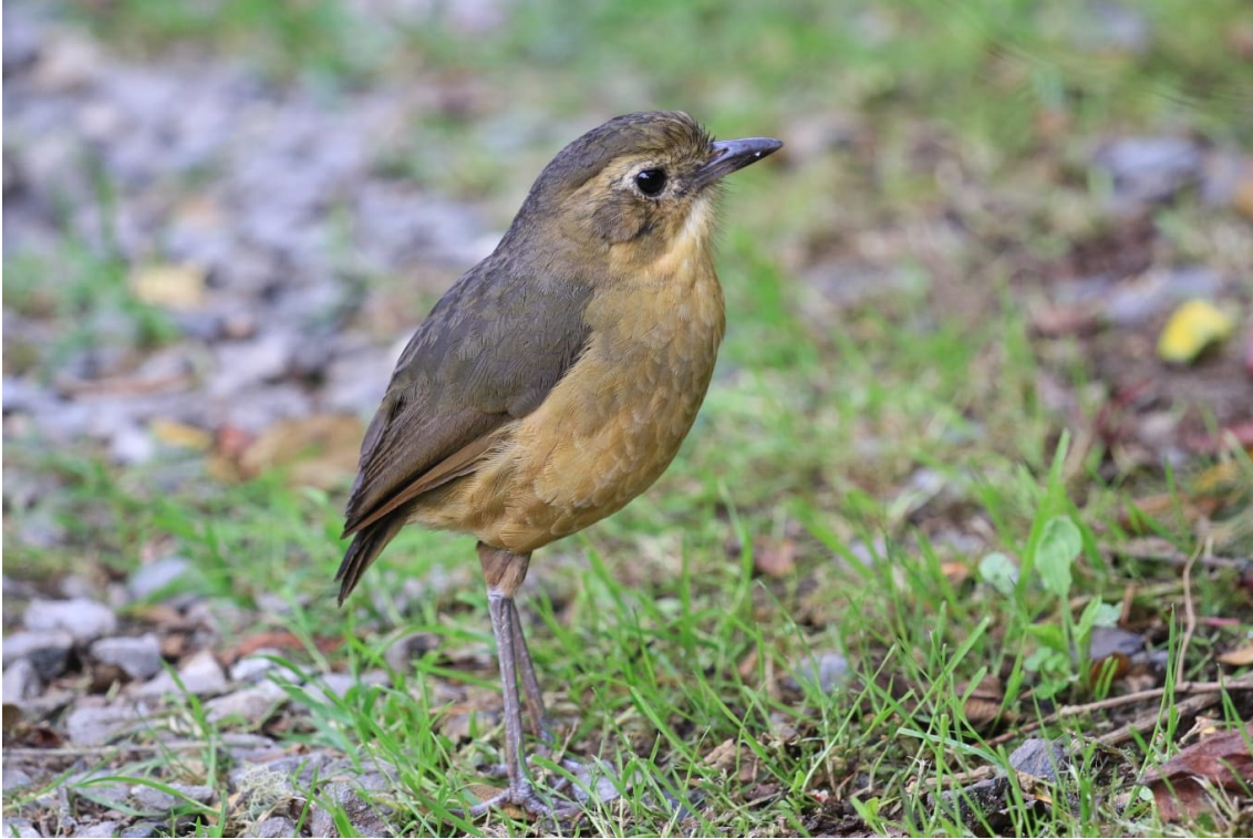
Tawny Antpitta en Termales del Ruiz

Brown-banded Antpitta Grallaria milleri (EN)