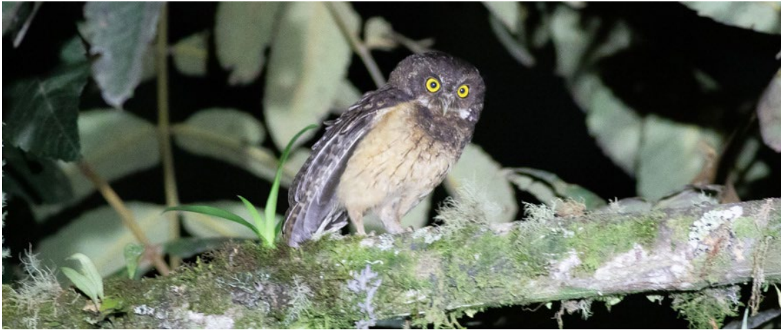
White-throated Screech-Owl en Manizales