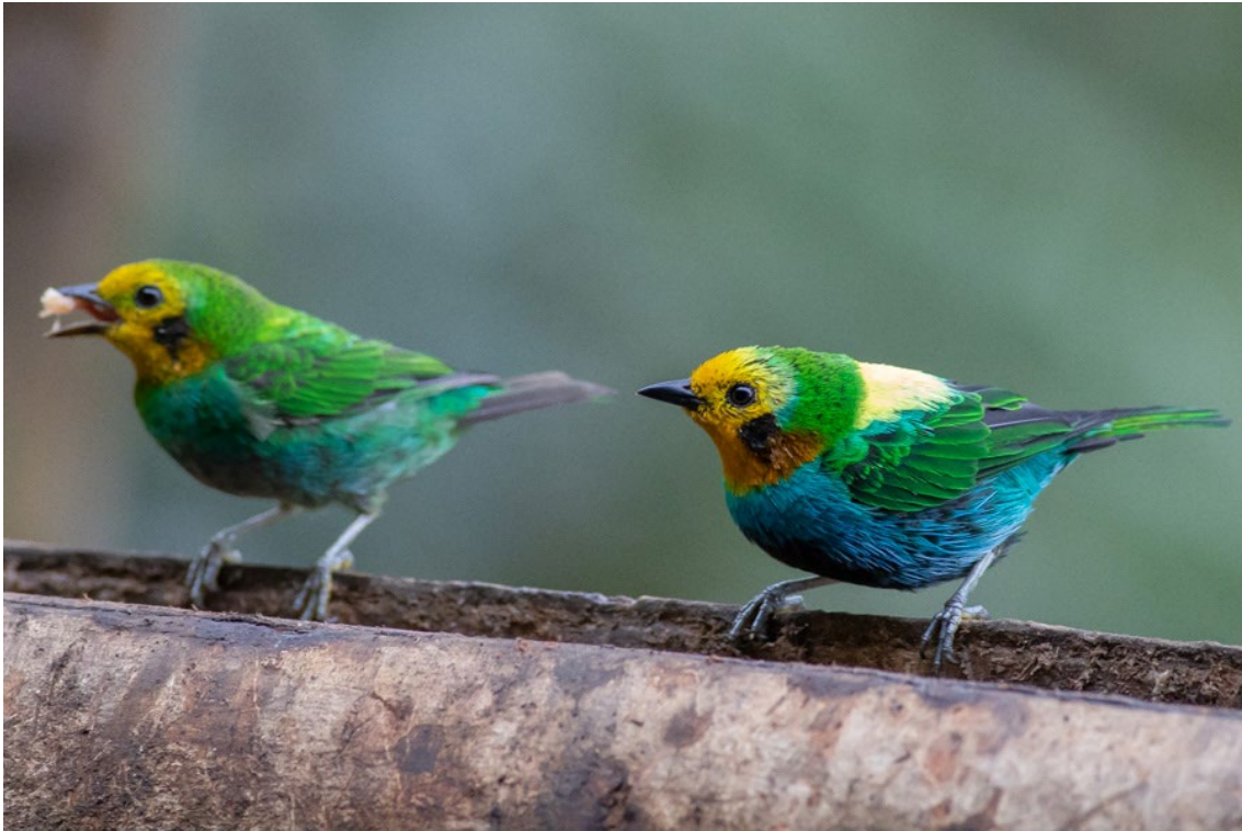
Multicolored Tanager en La Florida

Multicolored Tanager Chlorochrysa nitidissima (EN)