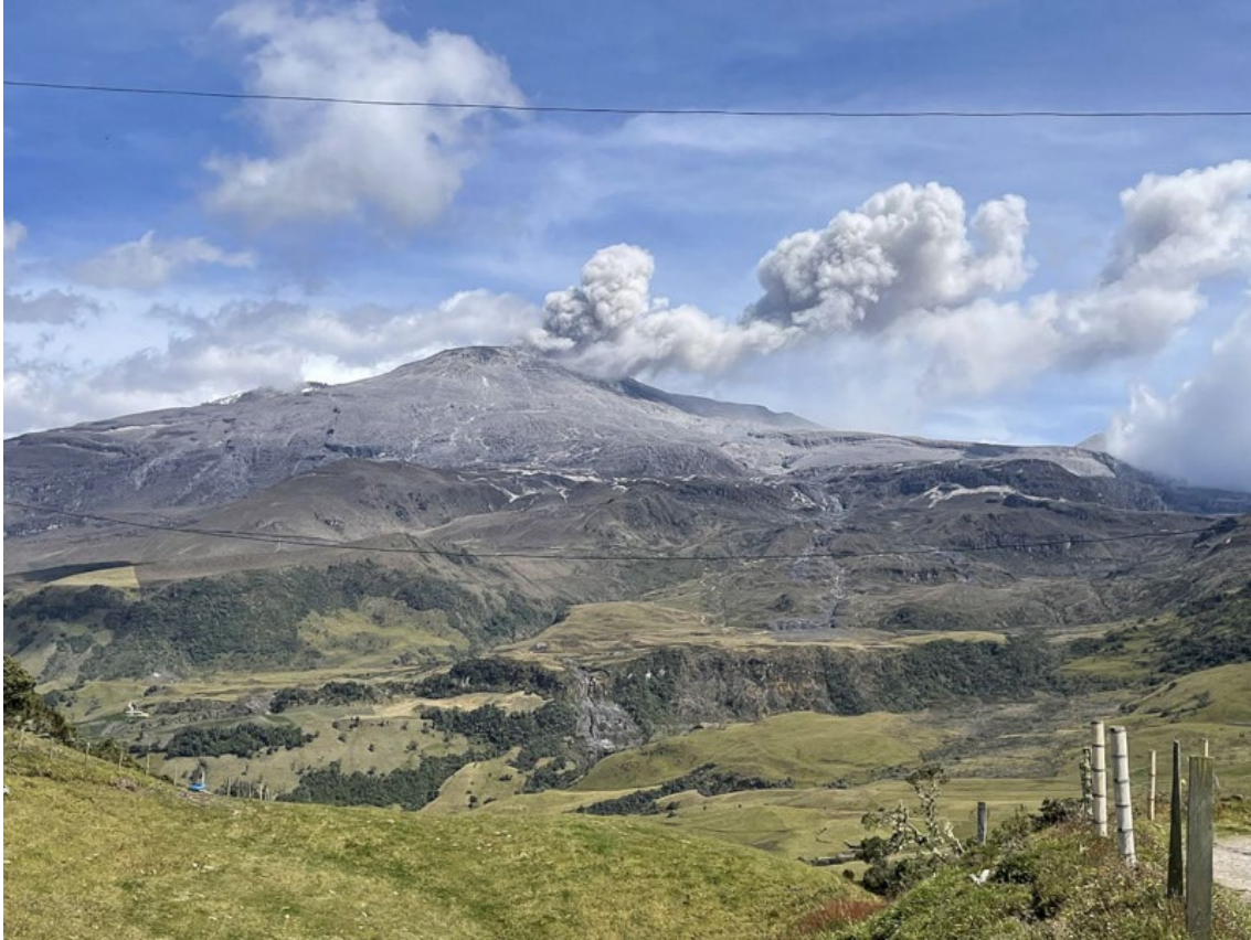
Imagen del volcán en el Parque Nacional Los Nevados