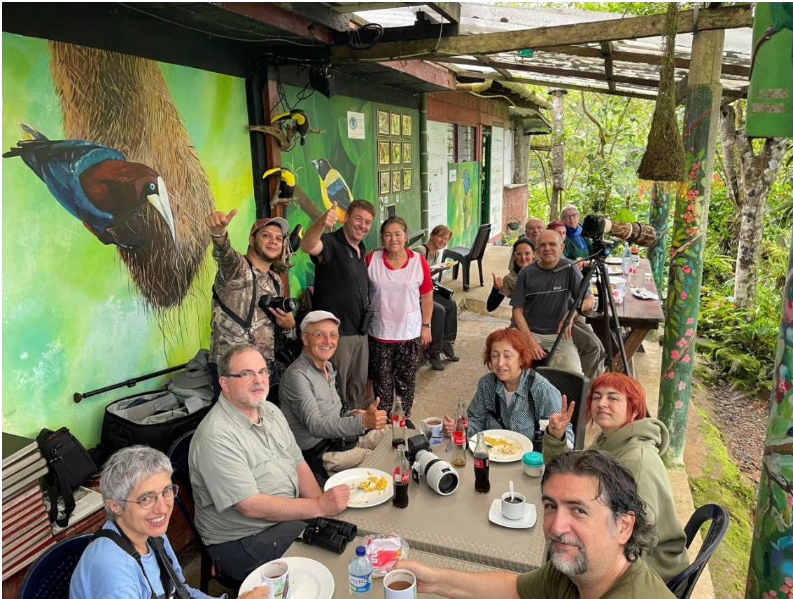
Almorzando en el Descanso de Doña Dora ©Ferran López