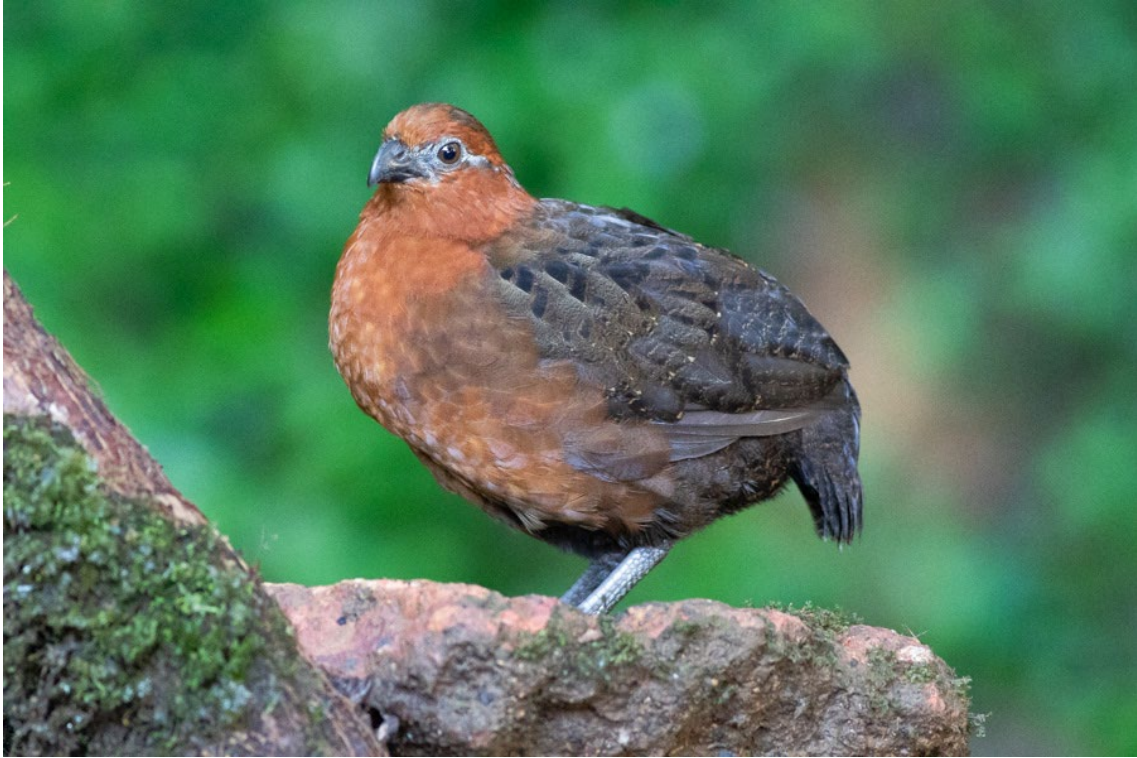
Chestnut Wood-Quail, en los hides de La Florida