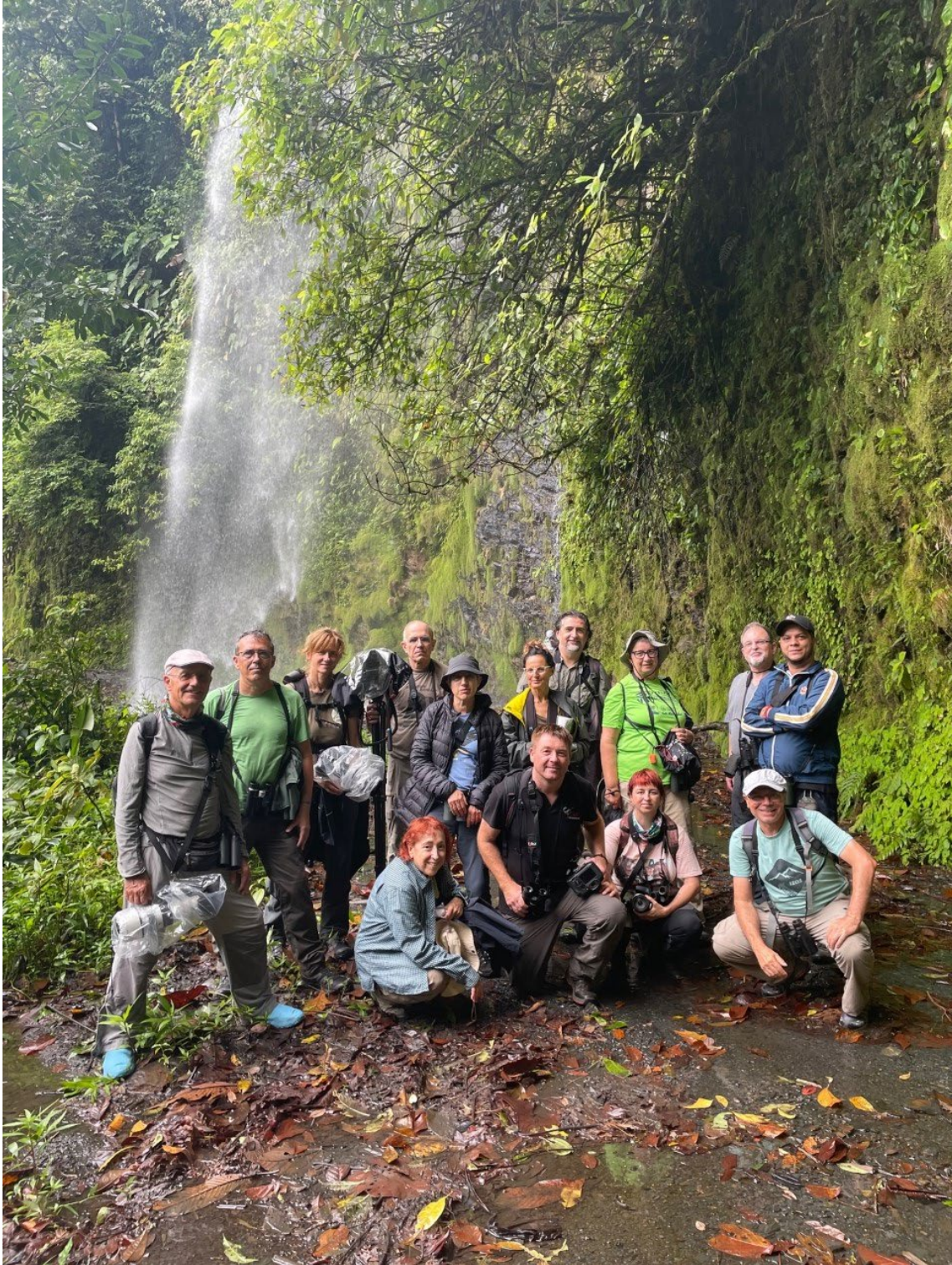
Foto de grupo junto a una de las cascadas en Anchicayá