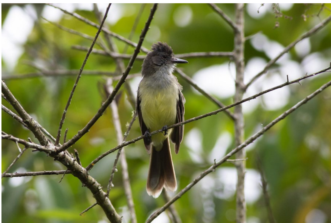
Apical Flycatcher en Cauquitá

Apical Flycatcher Myiarchus apicalis (EN)