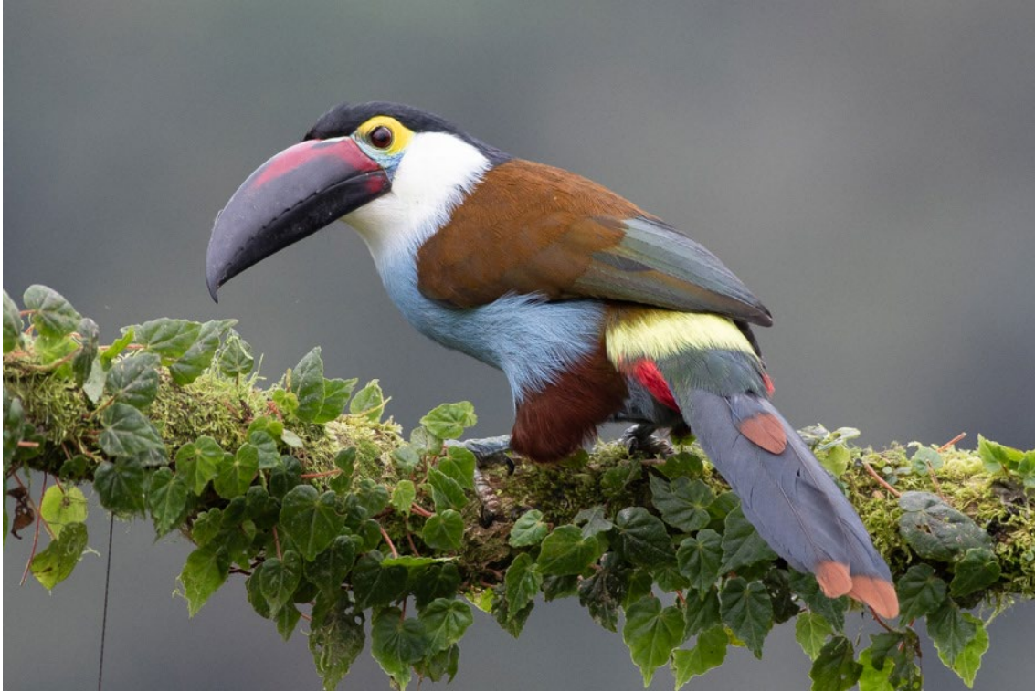
Black-billed Mountain-toucan en el Glamping El Color de Mis Rêves

Collared Araçari Pteroglossus sanguineus (EN)