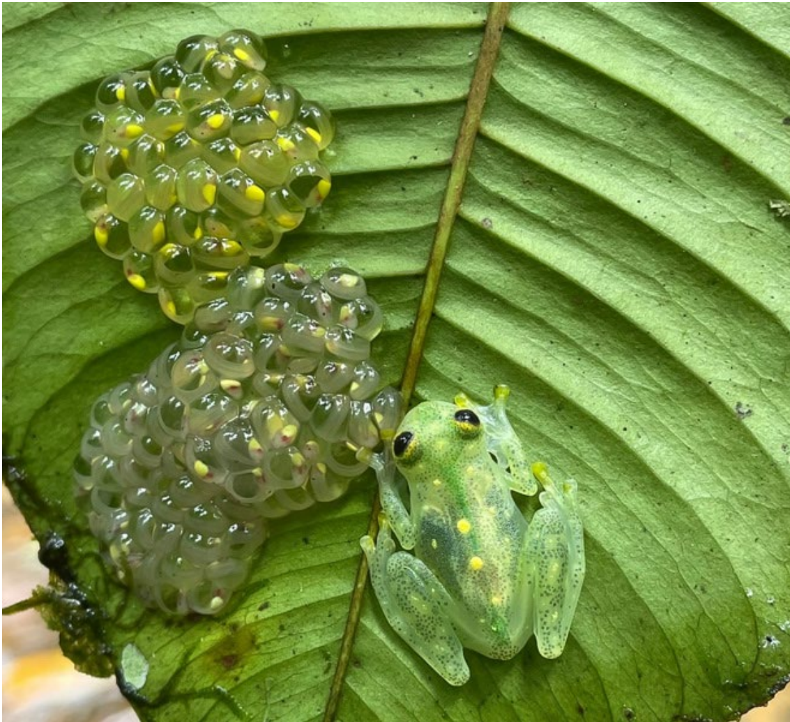
Puesta de una de las ranitas de cristal observadas en San Cipriano