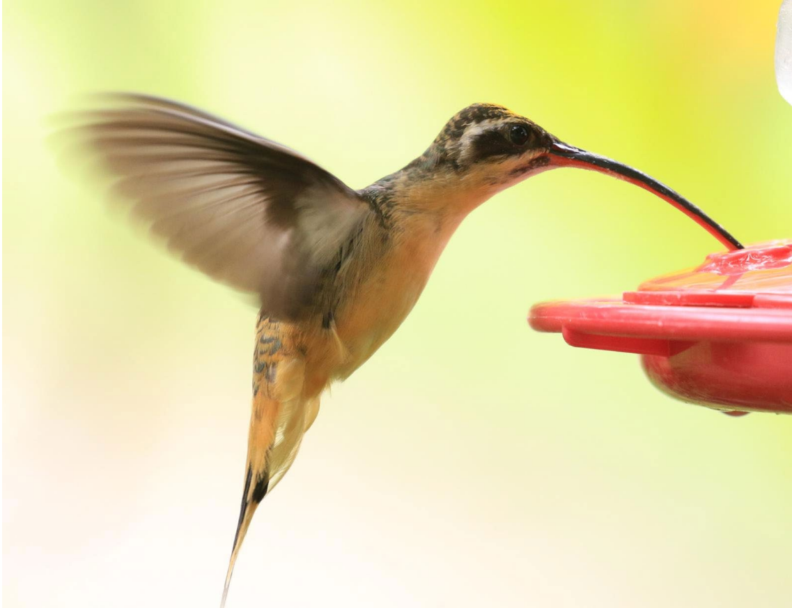
Tawny-bellied Hermit en el PN de Tatamá

Green-fronted Lancebill Doryfera ludovicae