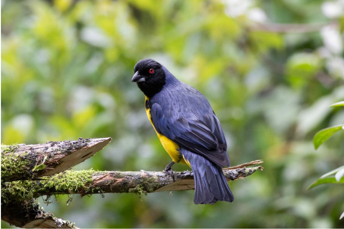
Hooded Mountain-tanager en Los Colores de Mis Rêves

Blue-capped Tanager Sporathraupis cyanocephala