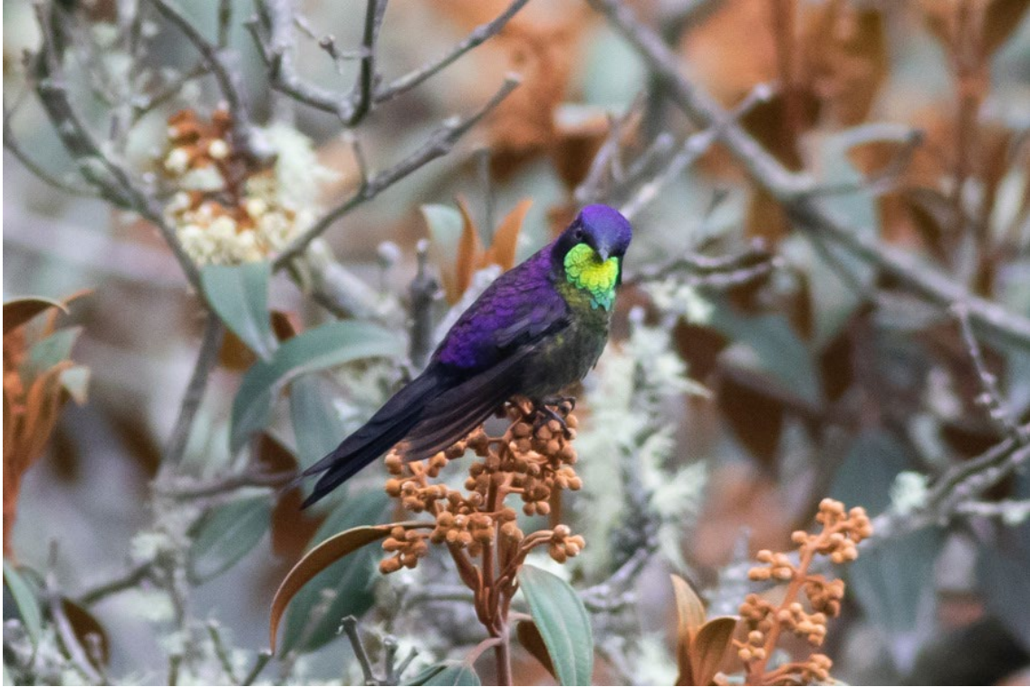
Purple-backed Thornbill macho por los alrededores de Termales del Ruiz

Rainbow-bearded Thornbill Chalcostigma herrani