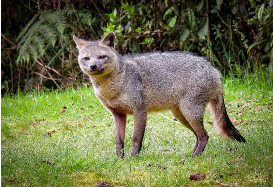
Crab-eating Fox o Zorro Cangrejero en el Glamping El Color de Mis Rêves