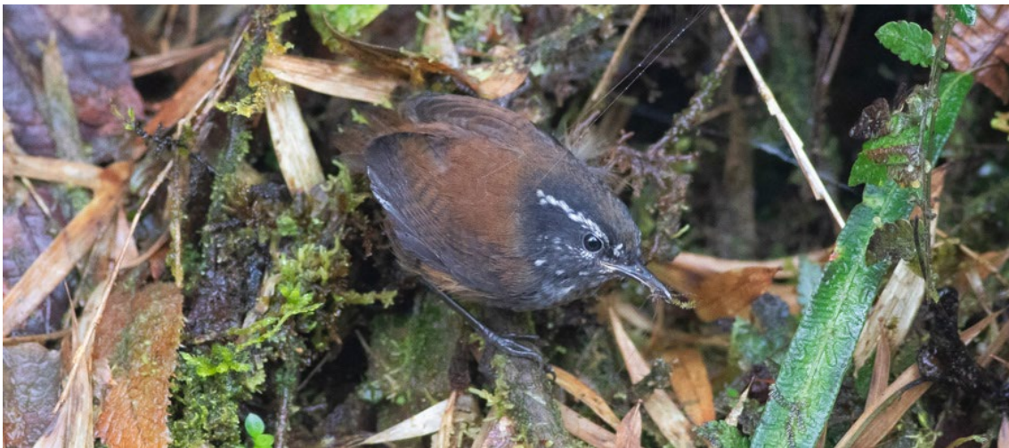
Chestnut-bellied Flowerpiercer y Munchique Wood-Wren, dos de las endémicas más importantes de las partes altas de Tatamá ©Ferran López