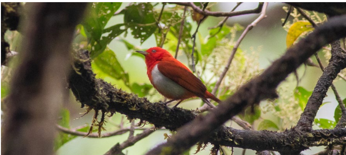
Scarlet-and-white Tanager, pájaro endémico del día en Anchicayá

Slaty-capped Flycatcher , Black-capped Pygmy-Tyrant , Southern Beardless-Tyrannulet , Long-tailed Tyrant , Bright-rumped Attila , Rusty-margined Flycatcher , Slaty-capped Shrike-Vireo , White-thighed Swallow , Southern Rough-winged Swallow , Scaly-breasted Wren , White-headed Wren , Bay Wren , Grey-breasted Wood-Wren , Fulvous-vented Euphonia , Orange-billed Sparrow , Scarlet-rumped Cacique , Tawny-crested Tanager , White-lined Tanager , Lemon-rumped Tanager , Golden-chested Tanager (endémico junto a Ecuador), Blue-necked Tanager , Emerald Tanager , Purple Honeycreeper y Slate-coloured Grosbeak , entre otras especies. Ya durante el ascenso, hicimos varias paradas en diferentes puntos cercanos al río donde vimos nuestro primer Green Kingfisher , Stripe-billed Aracari , Dusky-faced Tanager , Smooth-billed Ani , Fasciated Tiger-Heron , Turkey Vulture y Variable Seedeater . Ya de noche nos alojamos en nuestro hotel en la ciudad costera de Buenaventura donde algo más relajados tuvimos una buena cena, repasamos nuestras listas del día y nos fuimos a dormir.