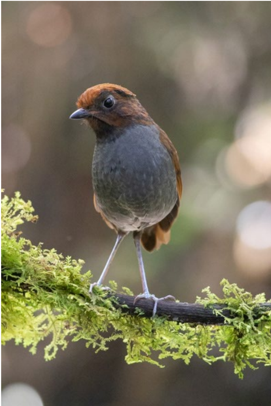
Bicoloured Antpitta desde uno de los hides del Glamping

cangrejeros que suelen visitar la zona y nos detuvimos en uno de los puntos para observar White-throated Screech-Owl . Llegamos a nuestro alojamiento después de un largo e intenso día, para cenar, repasar la lista diaria y descansar.