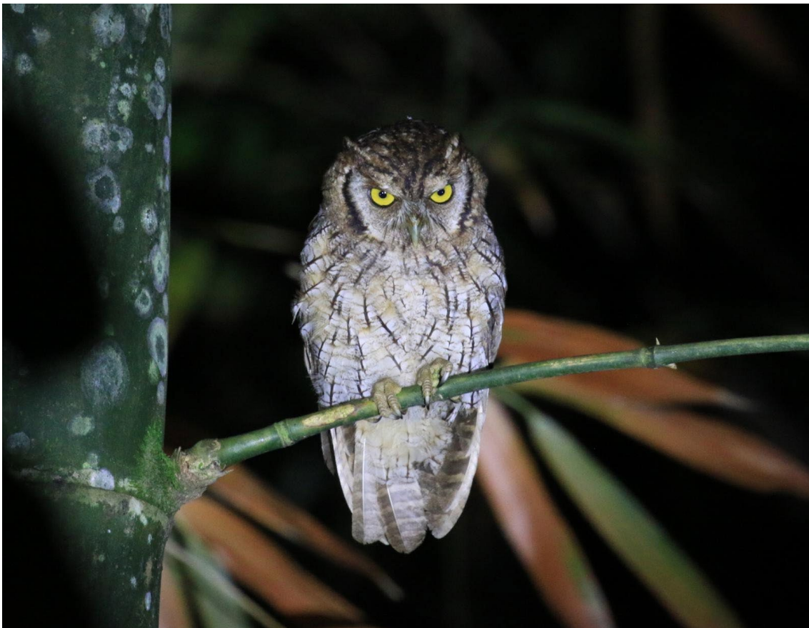
Tropical Screech-Owl en Pereira