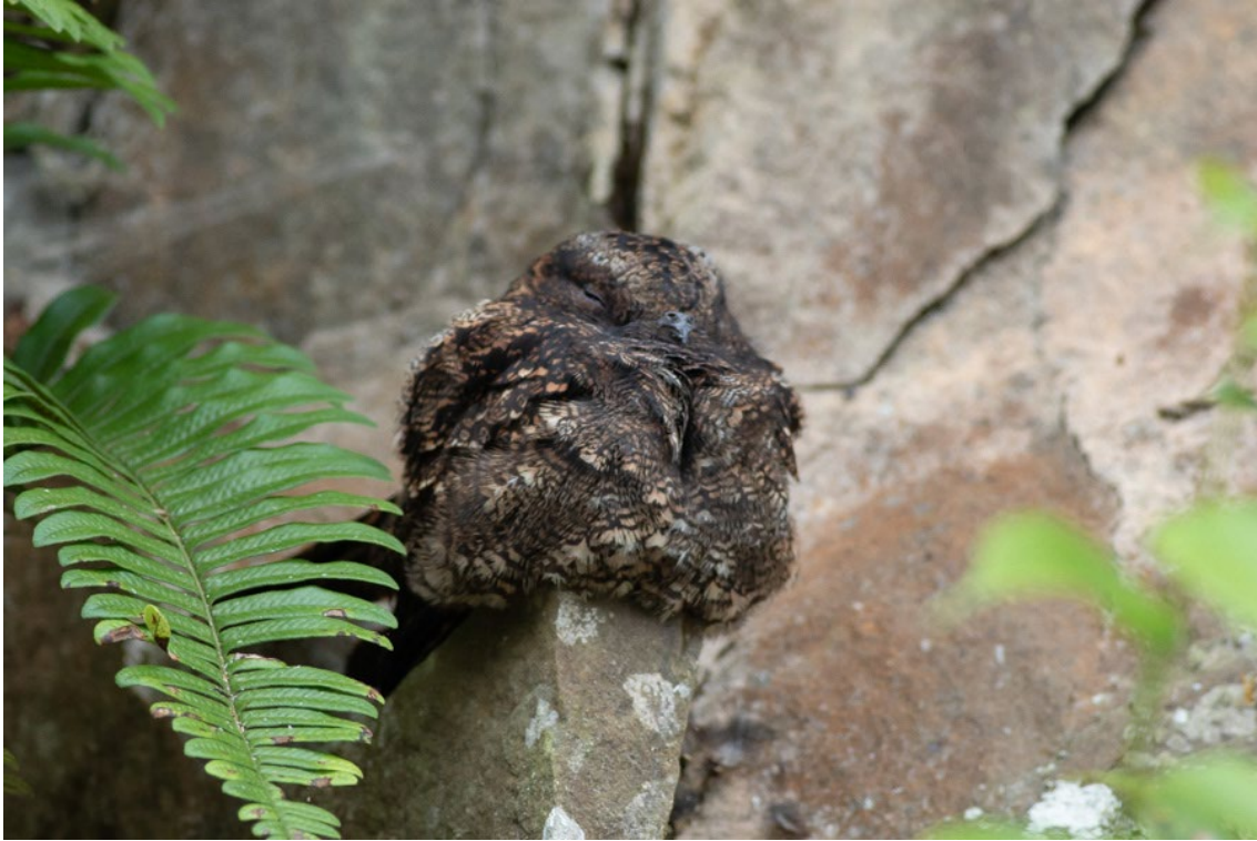
Lyre-tailed Nightjar hembra en Anchicayá