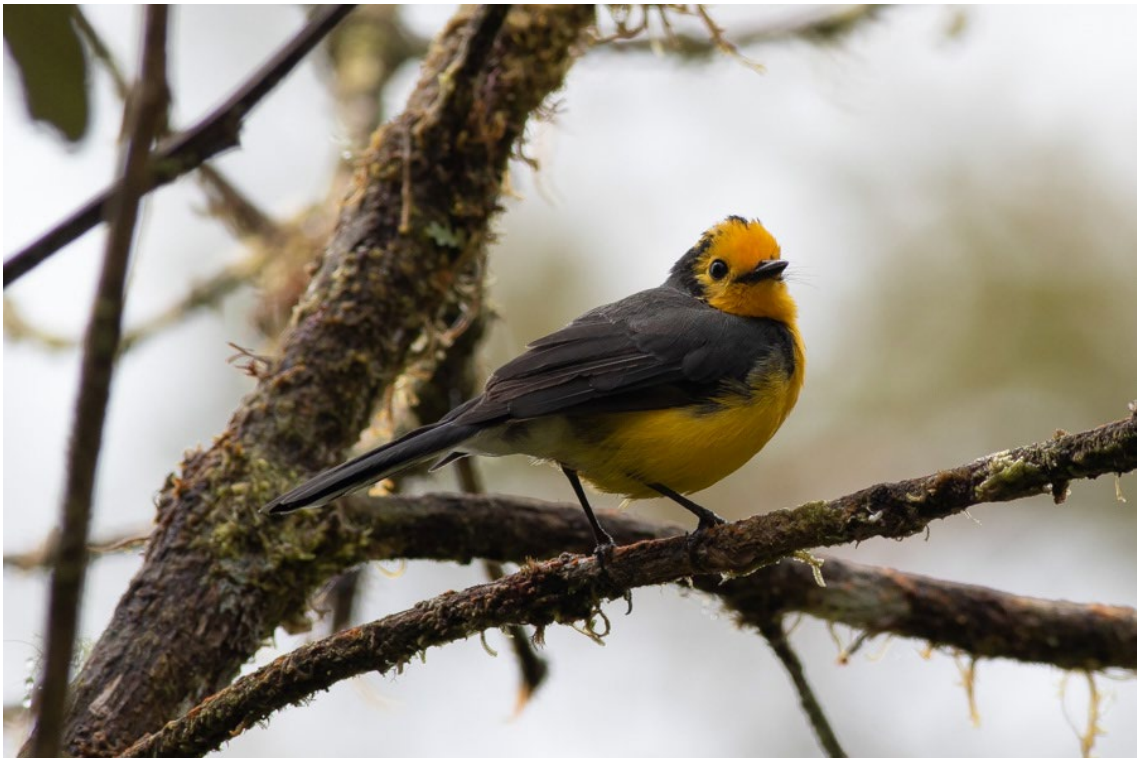
Golden-fronted Whitestart en el PN de Tatamá

Tropical Parula Setophaga pitiayumi Three-striped Warbler Basileuterus tristriatus Black-crested Warbler Myiothlypis nigrocristata Buff-rumped Warbler Myiothlypis fulvicauda Choco Warbler Myiothlypis chlorophrys Russet-crowned Warbler Myiothlypis coronata Slate-throated Whitestart Myioborus miniatus Golden-fronted Whitestart Myioborus chrysops (EN)