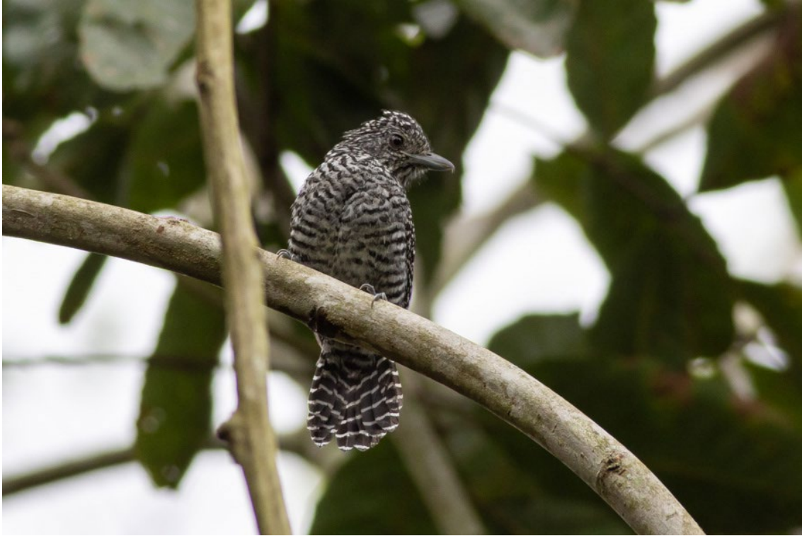
Bar-crested Antshrike macho en Cauquitá

Black-crowned Antshrike Thamnophilus atrinucha