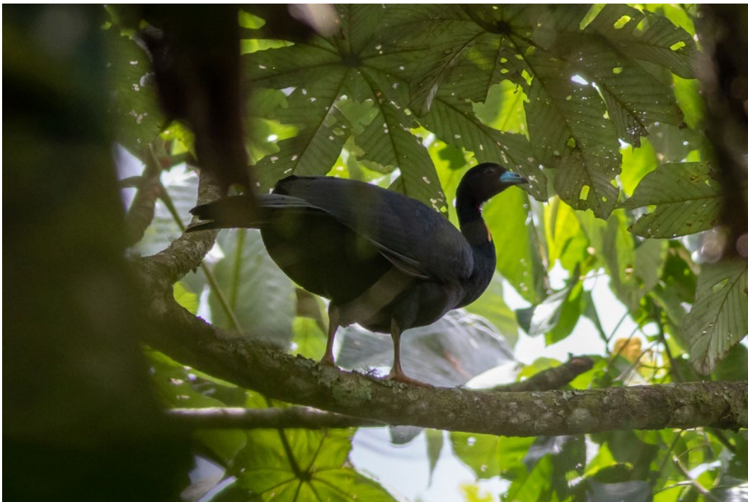
Wattled Guan, una de las pavas más difíciles de observar en Otún Quimbaya

Golden-olive Woodpecker , Spillmann's Tapaculo , Strong-billed Woodcreeper , Montane Woodcreeper , Montane Foliage-gleaner , dos Andean Cock-of-the-rock , Red-ruffed Fruitcrow , White-winged Becard , Rufous-breasted Flycatcher , Marble-faced Bristle-Tyrant , Bronze-olive Pygmy-Tyrant , Scale-crested Pygmy-Tyrant , Torrent Tyrannulet , Slaty-backed Chat-Tyrant , Brown-capped Vireo , Green Jay , Whiskered Wren (escuchado), White-capped Dipper , Common Chlorospingus , Fawn-breasted Tanager , Beryl-spangled Tanager , Golden Tanager y Black-winged Saltator , entre otras. Después de un reparador almuerzo mientras veíamos volar Buff-necked Ibis , nos desplazamos con nuestro minibús dirección Manizales, donde nos alojaríamos tres noches en el mismo hotel, pero visitando cada día lugares distintos. Cena, repaso de la lista diaria y a dormir.