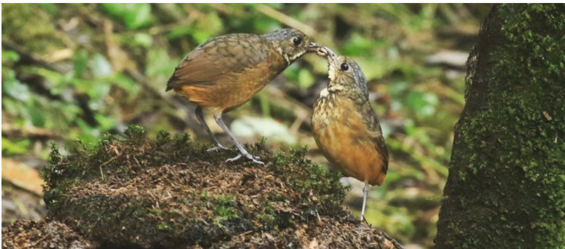
Scaled Antpitta en La Florida