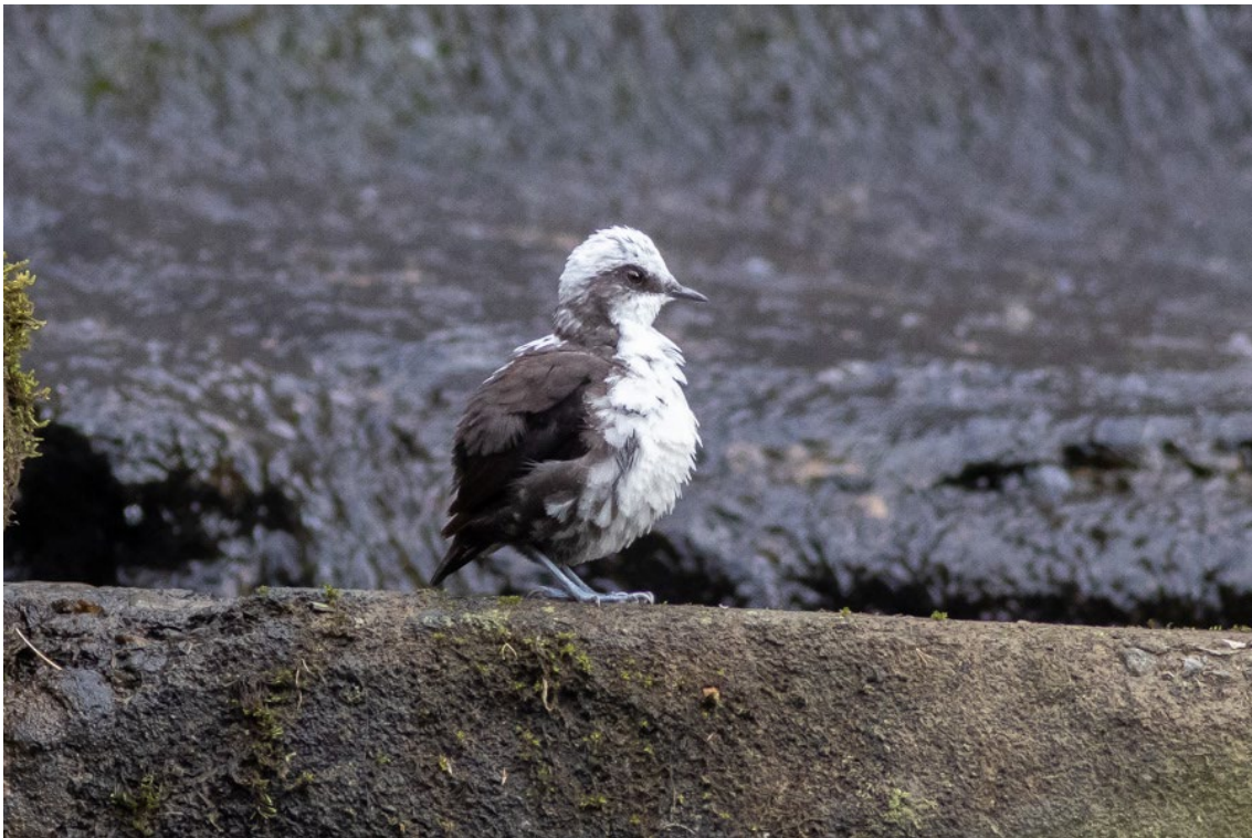
White-capped Dipper en Río Blanco

White-capped Dipper Cinclus leucocephalus