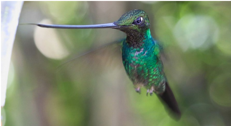
Sword-billed Hummingbird en Hacienda el Bosque

Sword-billed Hummingbird Ensifera ensifera