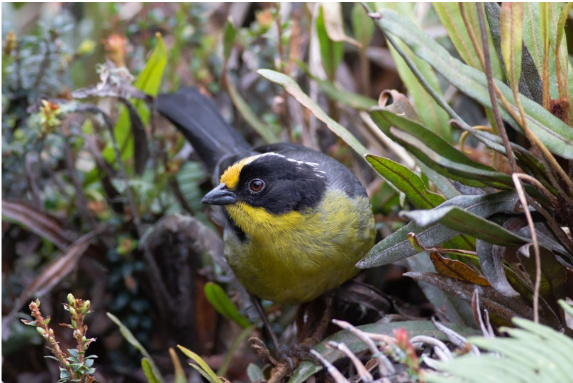
Pale-naped Brushfinch en Termales del Ruiz

Yellow-collared Chlorophonia Chlorophonia flavirostris (EN) Orange-crowned Euphonia Euphonia saturata Thick-billed Euphonia Euphonia laniirostris Fulvous-vented Euphonia Euphonia fulvicrissa Orange-bellied Euphonia Euphonia xanthogaster Lesser Goldfinch Spinus psaltria Yellow-bellied Siskin Spinus xanthogastrus Chestnut-capped Brushfinch Arremon brunneinucha Rufous-collared Sparrow Zonotrichia capensis White-naped Brushfinch Atlapetes albinucha Choco Brushfinch Atlapetes crassus Slaty Brushfinch Atlapetes schistaceus Pale-naped Brushfinch Atlapetes pallidinucha