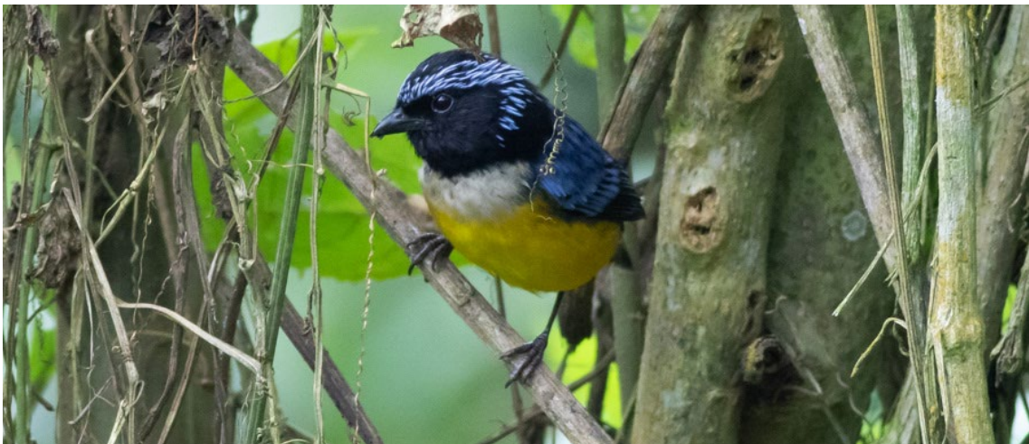
Buff-breasted Mountain-tanager en Río Blanco

Buff-breasted Mountain-tanager Dubusia taeniata