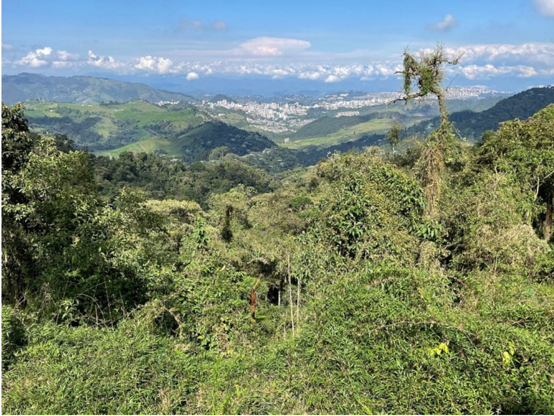
Vistas de la ciudad de Manizales desde la Reserva Natural de Río Blanco