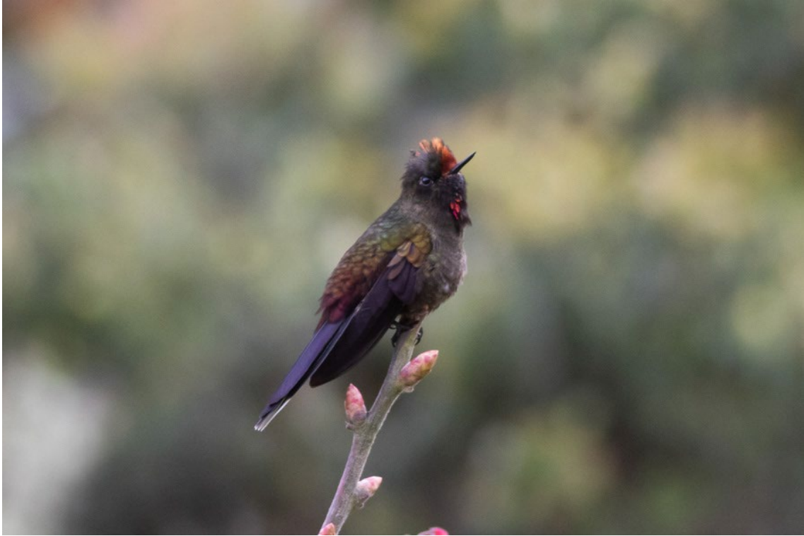
Rainbow-bearded Thornbill por los alrededores de Termas del Ruiz