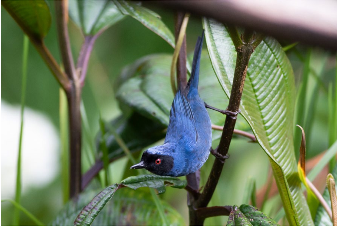
Masked Flowerpiercer en Río Blanco

Plumbeous Sierra Finch Geospizopsis unicolor