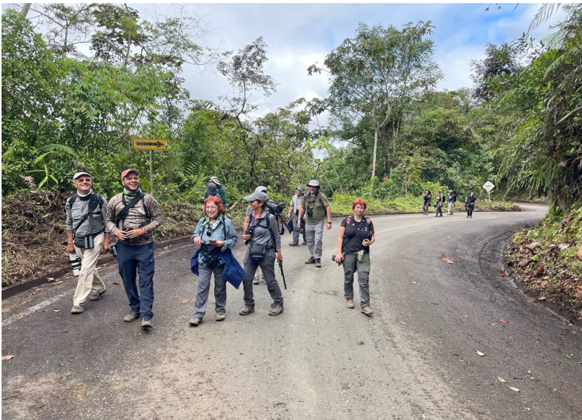
Pajareando por la carretera en el Alto Anchicayá