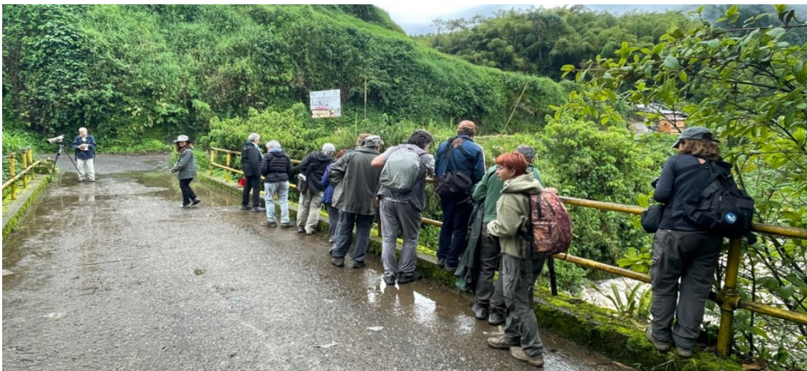
Observando White-capped Dipper desde uno de los puentes del río Otún

Fork-tailed Flycatcher , Apical Flycatcher (endémico), Streaked Flycatcher , Yellow-crowned Tyrannulet , Mouse-coloured Tyrannulet , Chivi Vireo , Tricoloured Munia , Grassland Sparrow , Black-striped Sparrow , Red-breasted Meadowlark , Yellow Oriole , Shiny Cowbird , Ultramarine Grosbeak , Scrub Tanager , Blue-necked Tanager , Bay-headed Tanager , Wedge-tailed Grass-Finch , Ruddy-breasted Seedeater , Thick-billed Seed-Finch , Large-billed Seed-Finch , Dull-coloured Grassquit , Yellow-bellied Seedeater , Grey Seedeater y Streaked Saltator , entre otras aves. Tras la comida, nos dirigimos hacia Otún Quimbaya donde aún tuvimos tiempo para pajear por la tarde por los alrededores del río Otún con muy buenas observaciones de White-tailed Kite , Sharp-shinned Hawk , Andean Motmot , Red-crowned Woodpecker , Blue-headed Parrot , Torrent Tyrannulet , Fork-tailed Flycatcher , White-capped Dipper y Carib Grackle , como más destacable. Nos alojamos en un encantador hotel del pueblo La Florida y tras cenar y repasar la lista nos fuimos a descansar.