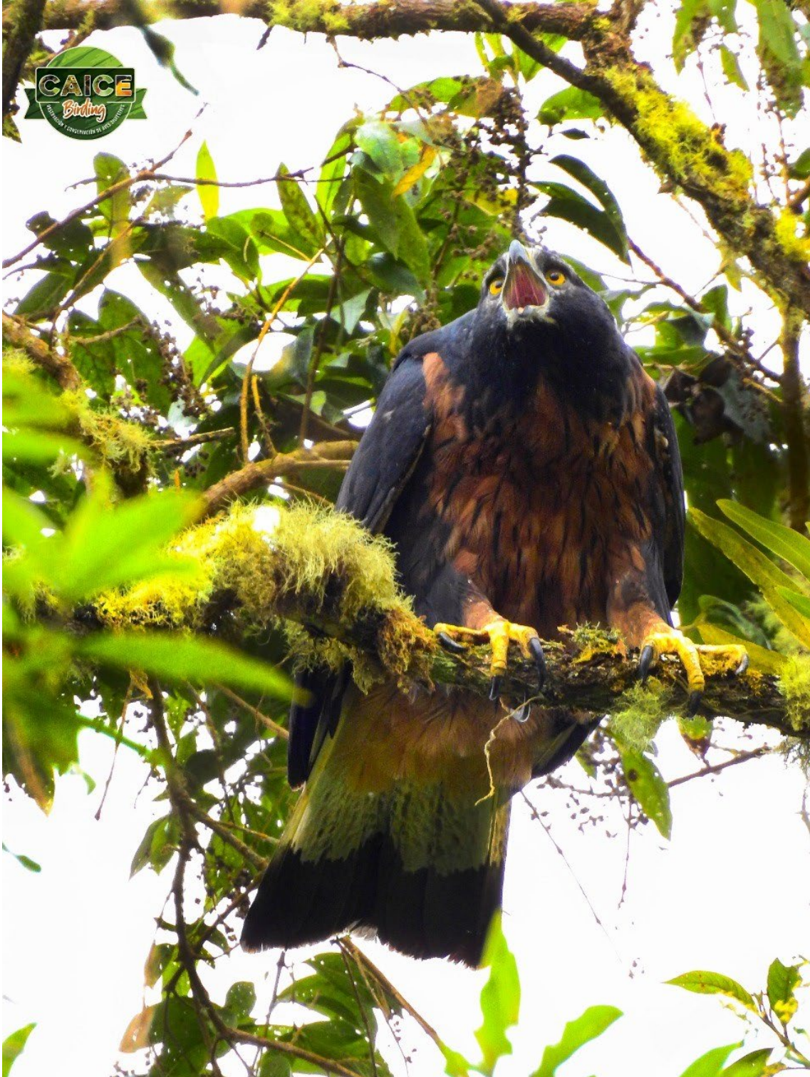
Black-and-chestnut Eagle