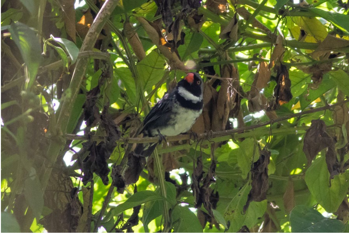
Masked Saltator en Río Blanco