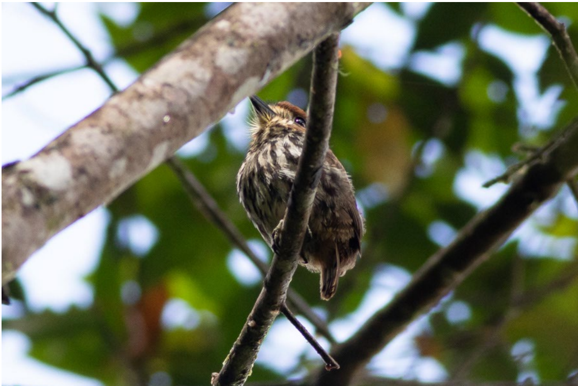
Lanceolated Monklet en el PN de Tatamá

Lanceolated Monklet Micromonacha lanceolata